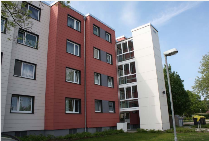
Emscherstr. 2 in BS-Weststadt - zusätzl. 6 Wohnungen im 1.- 3. OG barrierearm erreichbar