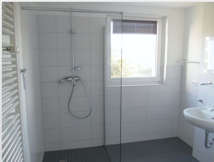
Wohnbeispiel An der Ziegelei 8 in Seesen

Bei Stranganierungen nach Bedarf und Möglichkeit auch alle Duschen bodengleich