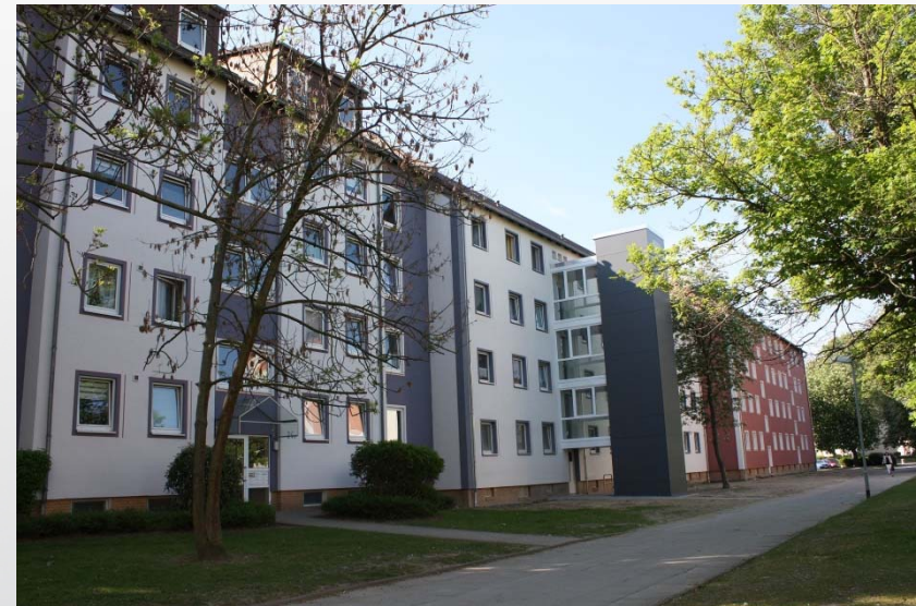
Lechstr. 24 in BS-Weststadt - zusätzl. 6 Wohnungen im 1.- 3. OG barrierearm erreichbar